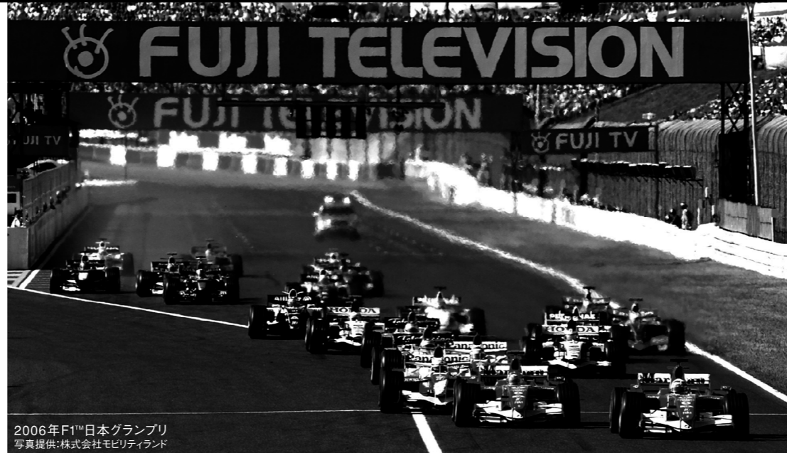
2006年F1™日本グランプリ