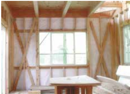
木造住宅の耐震改修