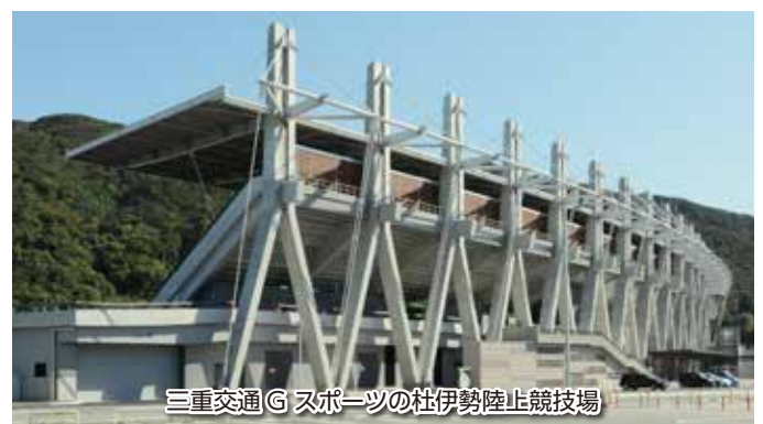
木材利用(みえ森林・林業アカデミー)