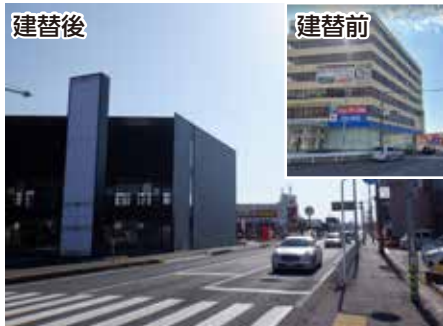
避難路沿道建築物の耐震化