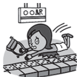
駅のホームで転んでケガをしたとき