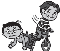
歩行者と接触してしまっ