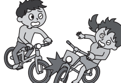
自転車同士衝突してしまっ