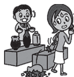
買い物中にお店の商品を壊してしまったとき