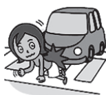
自動車（自転車）などにはなられケガをしたとき