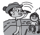
ゴルフで他人にケガをさせてしまったとき