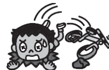
転倒によるケガなど